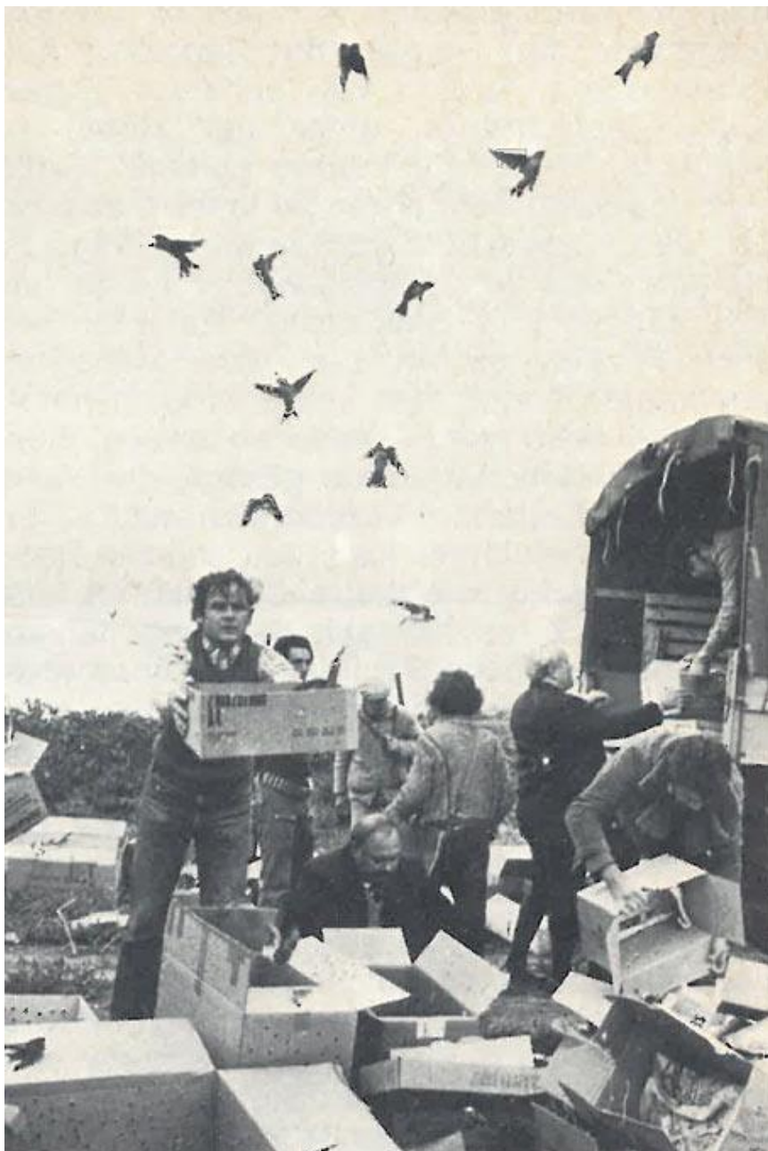
Schwalbenaktion 1974: Zehn Kilometer landeinwärts von Montpellier werden die Schwalben in einem strauch-, wasser- und mückenreichen Gebiet freigelassen.

Daraufhin versuchten wir die Bahntransporte nach Basel zu stoppen und alle Schwalbensen­dungen über Echterdingen in den Süden zu leiten. Es wurden Sammeltransporte organisiert, von Hauingen über Offenburg nach Echterdingen, von Ulm und Biberach und von vielen anderen Orten mehr. Aber nicht nur Linienmaschinen nahmen Schwalben auf, auch die Bundeswehr machte einige Male in Echterdingen Zwischenlandung und nahm auch von anderen Orten aus Schwalbentransporte mit nach Sardinien oder Portugal. Am 12. Oktober waren zunächst 10.000 Schwalben vom DBV-Kreisverband Pfalz angekündigt worden, tatsächlich kamen dann über 50.000 Schwalben von Landau nach Stuttgart-Echterdingen. Da schafften es die Linienmaschinen nicht mehr. In dem Augenblick sprang das Tierhilfswerk Heidelberg in die Bresche und charterte eine Maschine, die nach Nizza flog. Dr. Wankel, der Konstrukteur des Wankel-Motors, übernahm die Garantie, die Chartersumme abzudecken, ehe das Geld von den anderen Beteiligten zur Verfügung gestellt wurde.