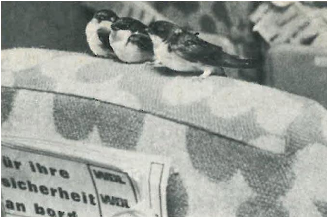
Schwalbenaktion 1974: Mehlschwalben im Flugzeug.

Es war wohl die größte Artenschutz-Hilfsaktion in der Geschichte des NABU: Als im Herbst 1974 unzählige Schwalben von einem plötzlichen Wintereinbruch überrascht wurden, sorgte der NABU zusammen mit vielen weiteren Vogelfreunden für den Transport von mehr als einer Million Vögeln.