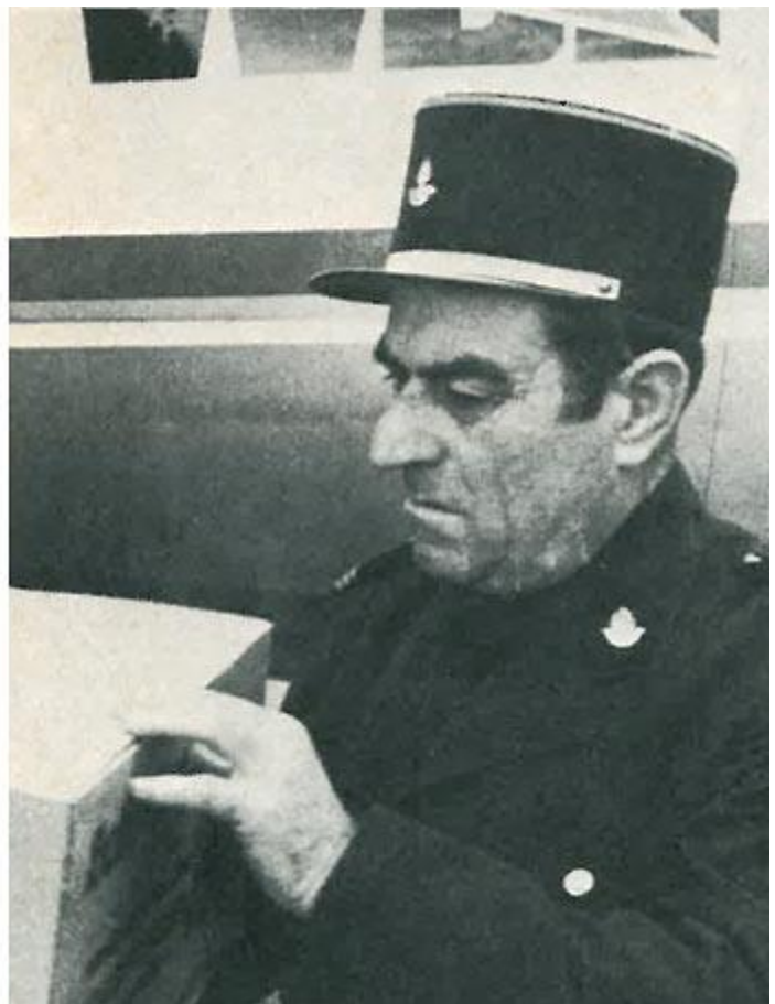
Schwalbenaktion 1974: Der Flughafen Stuttgart war Verladestation für die südwestdeutschen Schwalben (Bild links); Beim Ausladen am Zielort halfen dann sogar die französischen Zöllner.

Die 2000 Schwalben teilen sich in etwa 70 % Mehl- und 30 % Rauchschatwen. Wie haben sie wohl den Flug überstanden? Offensichtlich gut! Denn schwirrendes Flügelschlagen erfüllt die Luft – unsere gefiederten Freunde fliegen in die Freiheit. Nur 40 Exemplare - 9 Mehl- und 31 Rauchschatwen – sind tot. Der höhere Anteil an Rauchschatwen geht darauf zurück, daß diese Vögel schon in weniger guter Verfassung die Reise überhaupt angetreten haben. Hunderte von Schwalben sind in den letzten Tagen durch meine und meiner Freunde Hände gegangen. Übereinstimmend stellten wir fest, daß die Rauchschatwen besonders abgemagert waren. Und wie geht es den „blinden Passagieren“ aus dem Kinzigtal? Von den 446 Vögeln haben nur 7 die Reise nicht überstanden.