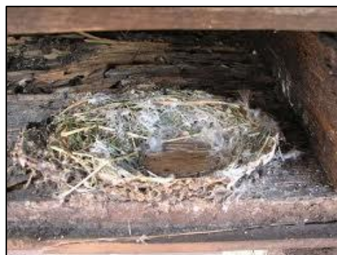
Gierzwaluwnest in nestkast