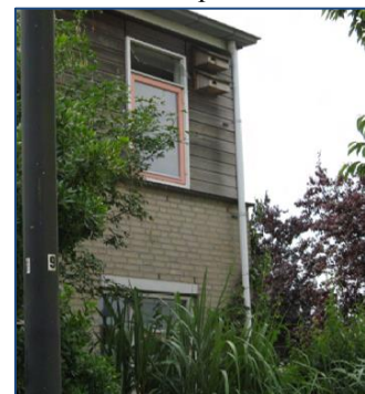
Nestkasten in Utrecht-Voordorp