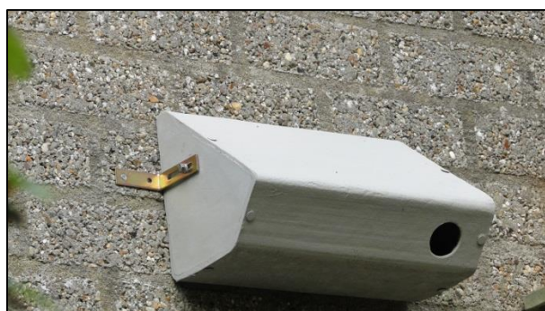
Gierzwaluwnestkast model "Maastricht"