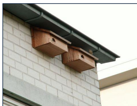
Voordorpkasten in Utrecht