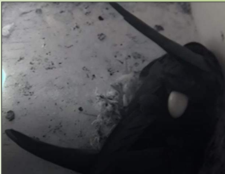
Zelden dat we de eileg zo mooi zien, meestal is het een gokje wanneer het ei precies gelegd is.

Rond half juni is er eindelijk rust in de kasten. Hoewel, rustig is het juist helemaal niet.... De adulte vogels vliegen af en aan om de jonkies van eiwitrijke insectenhapjes te voorzien. Maar dat is de normale hectiek in het broedseizoen waar we iedere keer weer blij van worden. Met de ogen nog dicht en hun gigantische bekjes wijd opengesperd worden de kale jongen voorzichtig gevoerd. De grotere jongen vechten om ieder hapje alsof het dagen geleden is dat ze iets gekregen hebben. Op zolder is het verschil ook duidelijk te horen. Uit de ene kast klinken zachte piepgeluidjes, in de andere kast hoor je ze al flink roepen. Het is ieder jaar weer een geweldig gezicht om te zien hoe snel die onbeholpen, kale jongen in zo'n korte tijd veranderen in zulke sterke, krachtige vogels.