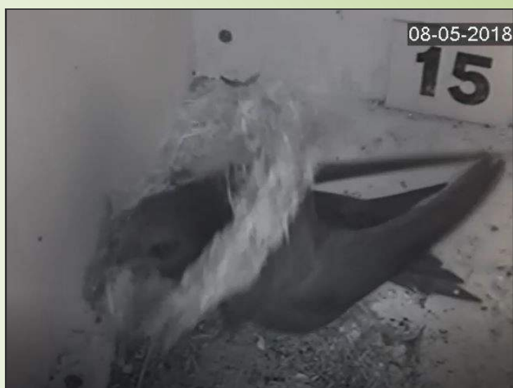
Na een aantal pogingen lukte het deze gierzwaluw om het gesloopte kommetje rond zijn nek te manoeuvreren om het vervolgens terug te slepen naar de uitgefreesde nestplaats.

Van gierzwaluwen is bekend dat ze ieder jaar een stukje verder bouwen aan hun nestkom. Maar ook ieder jaar proberen de spreeuwen er een stokje voor te steken. Vaak is de nestkom vernield of vinden ze hem, deels gesloopt, elders terug in de kast. Dit jaar konden we mooi zien hoe de gierzwaluwen er alles aan doen om hun nestkom toch weer terug te slepen naar de oorspronkelijke plaats achterin de nestkast.