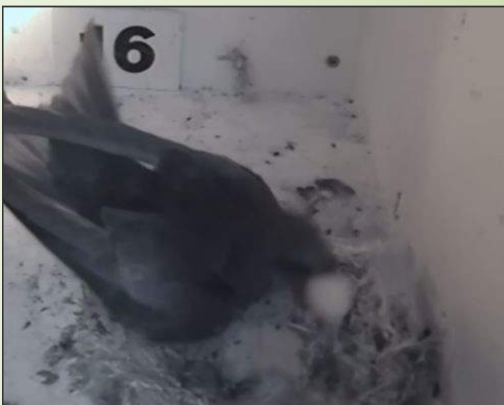
Door de beweging is de foto niet scherp maar duidelijk is te zien dat de gierzwaluw het ei in de bek neemt. Even later gooit hij het door de invliegopening naar buiten.