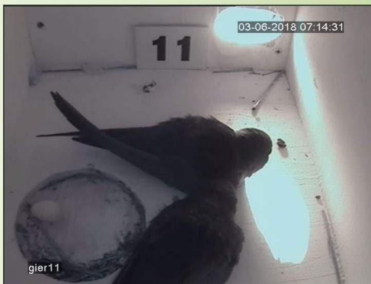
Wel een ei maar geen nestkom, dat gaat dus niet goed

Het meest opvallende koppel was dat in kast 11. Al in 2017 was deze kast bewoond. Overdag zaten er vaak 2 vogels, 's nachts was het er altijd maar één. En hoewel er uitgebreid 'gepluimd en geknuffeld' werd, was er geen teken tot nestbouw. Dit jaar waren ze er pas op 22 mei en het patroon van vorig jaar leek zich te herhalen. Dikke maatjes maar van nestbouw was geen sprake. En toen lag er 3 juni plotseling een ei, in het uitgefreesde, houten kommetje. Twee dagen later werd een tweede ei gelegd maar hierbij werd het eerste ei per ongeluk eruit gestoten. De dagen hierna herhaalde dit patroon zich steeds. Eieren per ongeluk eruit waarna ze met veel moeite weer werden teruggerold. Maar inmiddels hebben de vogels nu toch ingezien dat een nestkom voordelen biedt en de laatste twee weken zijn ze flink in de weer met veertjes, strootjes en allerlei ander materiaal. Tussen het broeden door werken ze fanatiek aan de nestkom.