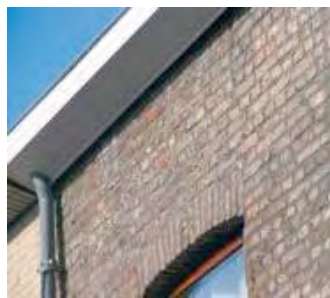
Figuur 5: Tussen de muur en de rand van de dakgoot is een spleet aanwezig waarachter gierzwaluwen nestgelegenheid kunnen vinden.