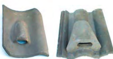
Figuur 6: Voorbeelden van gierzwaluwdakpannen.

De invliegopening is zo geconstrueerd dat er geen gevaar is voor inregenen. Dus onder de pannen blijft het perfect droog. Deze pannen kunnen het beste in groepen halverwege het dak worden gelegd met een tussenruimte van drie gewone pannen. Plaats de pannen best in een grillig patroon, zodat de nestplaatsen herkenbaarder zijn voor de gierzwaluwen. Het noorden of oosten zijn de enige geschikte windrichtingen voor gierzwaluwpannen. Op andere richtingen wordt het nest bij zonnig weer veel te warm. Hoe steiler een dak, hoe beter. Daken met een hellingshoek minder dan 45 graden zijn niet geschikt omdat de nesten dan steeds in de felle zon komen te liggen gedurende de dag. Tevens worden dan ook de uitvliegmogelijkheden te veel beperkt.